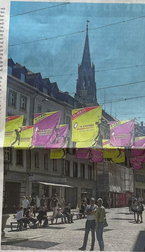
In St. Gallen sind die Flaggen für das anstehende Jugendmusikfest gehisst.

Auch für das leibliche Wohl ist gesorgt: Über 20 000 Mahlzeiten muss die auf dem Olma-Areal verankerte Sänktis Gastronomie am Wochenende für die Musikantinnen und Musikanten zubereiten. Dass man den Jugendlichen nicht drei Tage lang Hörnli mit Ghackets vorsetzen wolle, verspricht Straub: «Das gibt es am ganzen Wochenende nur einmal.» Man habe aber auf jeden Fall darauf geachtet, einen Menüplan zusammenzustellen, der allen schmecken sollte – hungern müssen auch Vegetarier und Personen mit Intoleranzen nicht. Genau so wenig übrigens die «zivilen» Festbesucherinnen und Festbesucher: An zahlreichen Ständen auf dem Olma-Gelände sollte so gut wie jeder Geschmack auf seine Kosten kommen. Um die Musikantenschar bei Laune zu halten