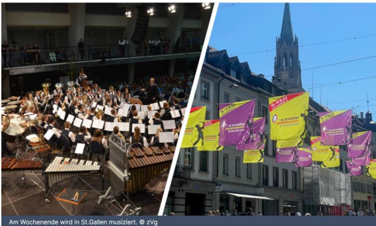
Am Wochenende wird in St.Gallen musiziert.

In St.Gallen findet am Wochenende das 18. Schweizer Jugendmusikfest statt. Über 4600 Teilnehmende und Helfende werden erwartet. Die Vorbereitungen sind seit Mittwoch in vollem Gange.